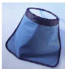
Protection 0.5mm Pb