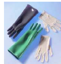
Protection 0.25mm Pb ou 0.50mm Pb