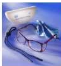
Protection 0.95mm Pb